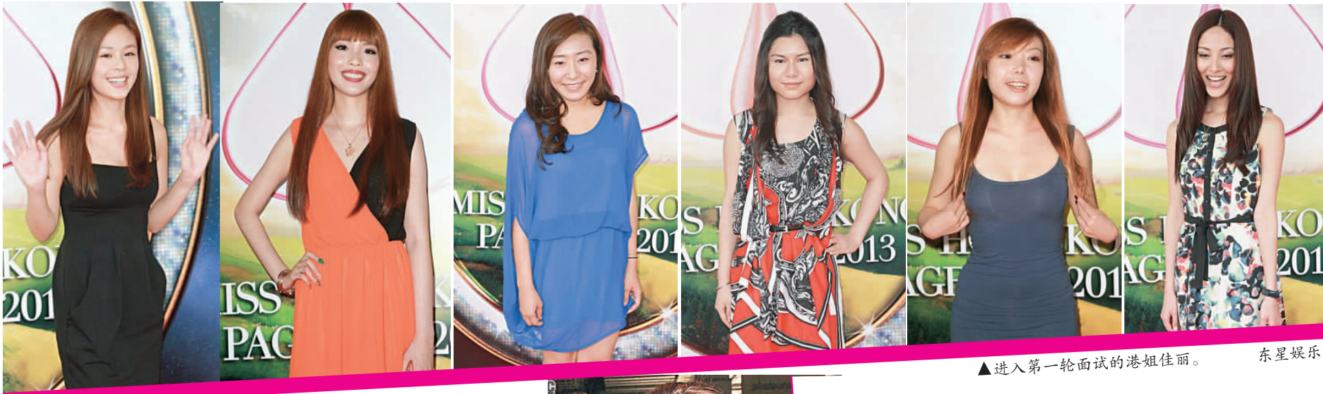
▲进入第一轮面试的港姐佳丽。 东星娱乐