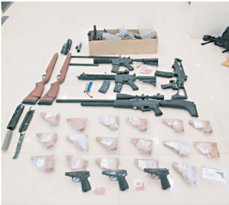
▲中美枪支走私案:国际邮包内私藏枪支零件。

警方在这个小型“军火库”查获了25支枪支、2429发子弹,以及9支自制猎枪、手枪、步枪、气步枪。