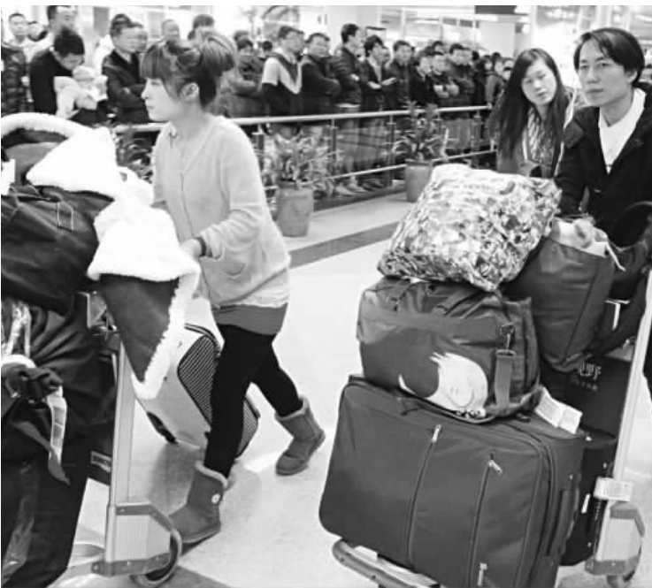
▲ 图为今年2月7日，回乡过年的华侨华人抵达福州长乐国际机场。

二是增加了规范外国留学生参加校外勤工助学和实习的规定。三是进一步明确了聘用外国人工作或者招收外国留学生的单位的报告义务。