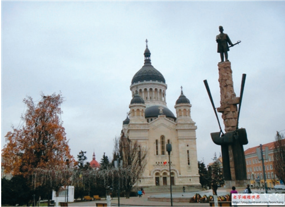
克卢日圣母安息教堂(Dormition of the Theotokos Cathedral)