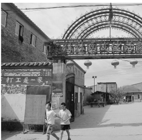
►两个孩子走出北京皮村社区文化服务中心，这个看似旧厂房的地方，是皮村居民的活动场所，也是新工人艺术团的办公地点。