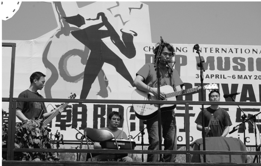
▲新工人艺术团演出现场。