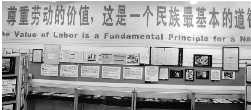
▼北京“打工艺术博物馆”的一个展室，位于社区文化服务中心的右侧，收藏了与打工相关的各类物品。