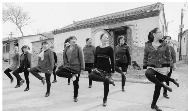
▲2013年3月初，北京门头沟区淤白村的村民踢踏舞队正在村中表演踢踏舞。2012年10月，淤白村农民踢踏舞队以一支独立舞蹈成功“挑战”知名踢踏舞《大河之舞》让淤白村名气大增。