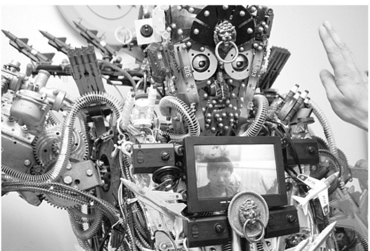
▲机器人的头部两侧装有感应摄像头，并能够通过胸前的显示器传递影像。